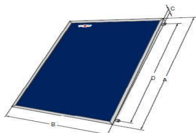
TopSon F3-1 / CFK-1